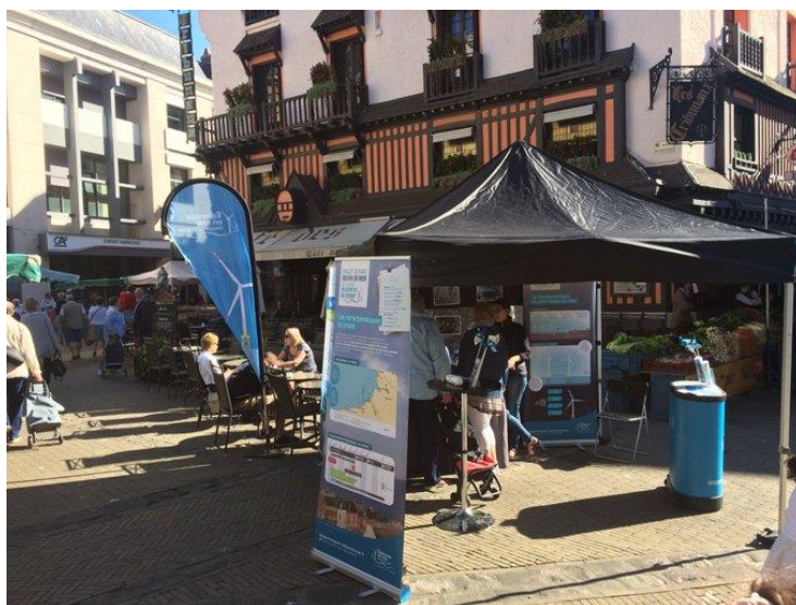
Figure 1. Stand EMDT sur le marché de Dieppe (EMDT, 2018).

Les emplois et le plan industriel liés au projet ont été le sujet le plus fréquemment interrogé par les passants, avec l'impact du parc sur le paysage littoral et les choix français en matière de politique énergétique, avec le développement notamment de nouvelles énergies marines renouvelables comme l'éolien flottant et l'hydrolien.