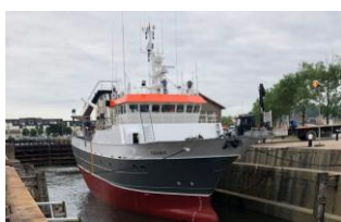
LE GOURY MMSI : 228467700 L x l : 30m x 8m