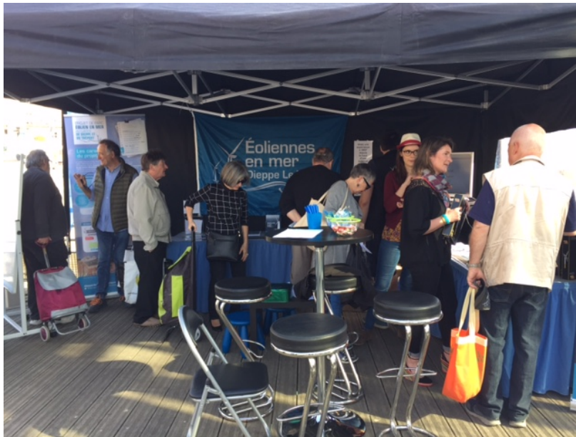
Figure 1. Stand EMDT lors de la Banana's Cup 2018 (EMDT, 2018).

L'impact du parc sur le paysage littoral, ainsi que les choix français en matière de politique énergétique ont été longuement interrogés par les personnes rencontrées. De même, que la capacité de production électrique du parc, les raisons pour lesquelles l'Etat a choisi d'implanter un parc dans cette zone et la cohabitation du parc avec les activités de pêche préexistantes.