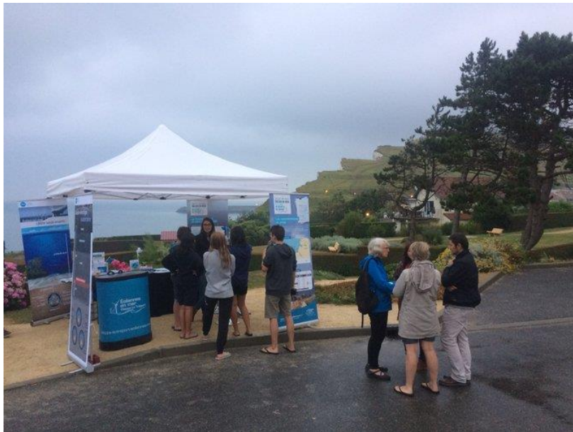
Figure 1. Le stand des Eoliennes en Mer Dieppe Le Tréport (EMDT, 2018).

Au total, plus d'une trentaine de personnes ont pu s'informer sur le stand déployé par le maître d'ouvrage et 26 personnes en ont profité pour échanger directement avec les équipes sur les différents enjeux du projet.