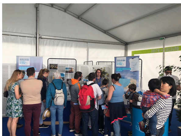
Figure 1 Le stand EMDT à l'Armada sur le port de Rouen

Le 15 juin 2019, les équipes du projet éolien en mer au large de Dieppe et du Tréport étaient présentes sur le port de Rouen à l'occasion de l'édition 2019 de l'Armada de Rouen. Elles ont ainsi pu informer sur le projet et recueillir les avis et propositions des visiteurs dans un stand qu'elle partageait avec la préfecture de Normandie.