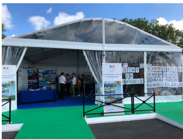
Figure 2. Le stand des Eoliennes en Mer Dieppe Le Tréport (EMDT, 2019).