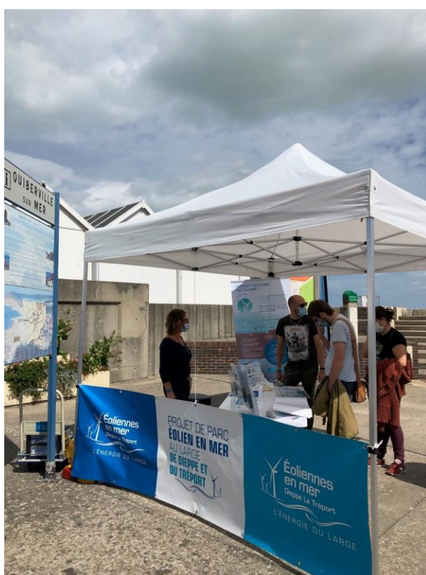
Figure 1. Le stand Éoliennes en Mer Dieppe Le Tréport sur la plage de Quiberville-sur-Mer (EMDT, 2020)

Profitant de la période estivale, les équipes du projet de parc éolien en mer au large de Dieppe et du Tréport ont installé leur stand d'information sur la plage de Quiberville sur mer les 20 et 27 aout 2020, afin d'aller à la rencontre des habitants et des touristes pour les informer sur le projet. La situation sanitaire n'a pas freiné l'intérêt du public et une trentaine de personnes sont venues échanger directement avec le porteur de projet et s'informer des dernières actualités dans le plus strict respect des mesures sanitaires.