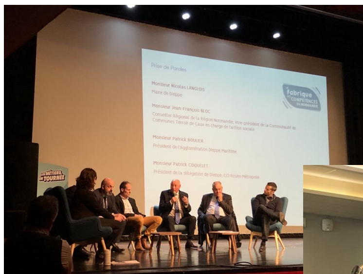
Figure 2 : Conférence thématique pendant l'évènement (EMDT, 2022)

Une majorité de visiteurs s'interroge sur l'avancement du projet. Nous avons indiqué aux visiteurs que nous avons obtenu les autorisations en février 2019, que des recours sont actuellement en cours sur le projet et qu'en attendant que ceux-ci soient traités par les autorités compétentes, le projet continuait à affiner les éléments techniques du parc et à avancer sur la contractualisation avec les fournisseurs potentiels pour la construction. Il a été indiqué que les travaux en mer menés par EMDT devraient commencer courant 2024 pour une mise en service du parc en 2026.