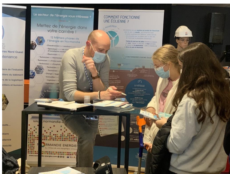
Figure 1. Le stand Éoliennes en Mer Dieppe Le Tréport (EMDT, 2022)

L'agence Régionale de L'orientation et des Métiers se déplace au plus près des normands pour proposer un parcours immersif au cœur des métiers. Quel que soit le profil ; Collégien, Lycéen, Etudiant, Adulte, l'agence propose des ateliers à la carte pour vous (ré) orienter et découvrir les filières d'excellence normandes. Plus de renseignement sur le site : https://parcours-metier.normandie.fr/agence-metiers-en-tournee