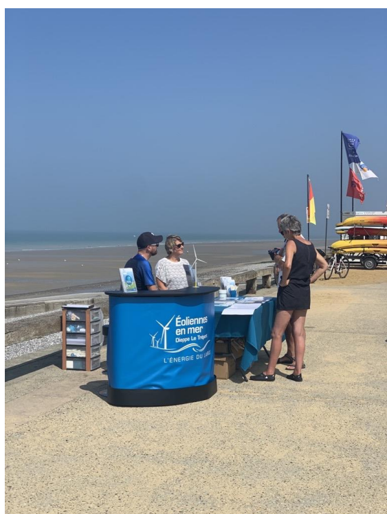
Figure 2. Le stand Éoliennes en Mer Dieppe Le Tréport sur la plage d'Ault (EMDT, 2022).